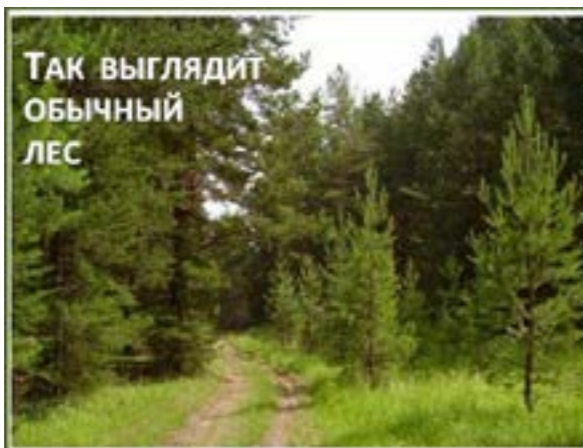
ТАК ВЫГЛЯДИТ ОБЫЧНЫЙ ЛЕС